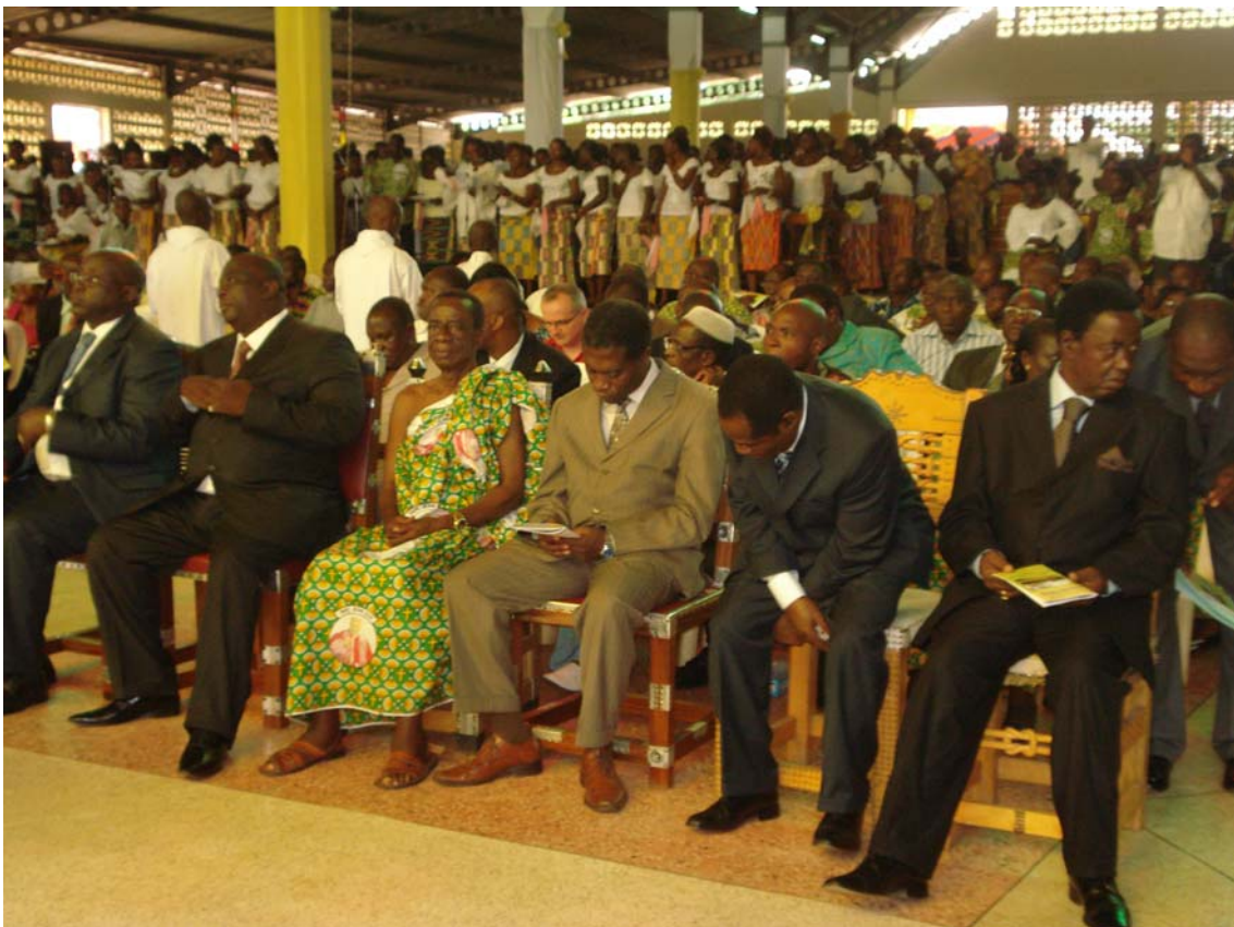
Autorità civili nazionali e locali