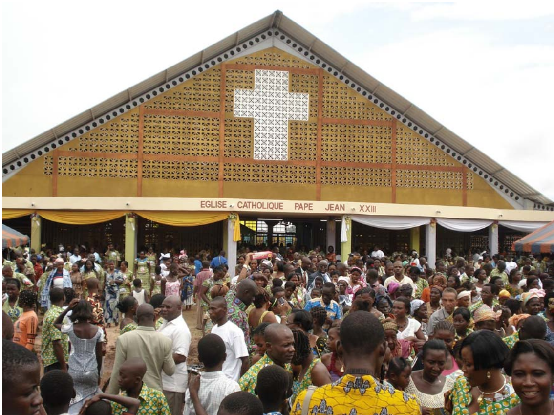
La grande partecipazione della gente del posto

Visto che con le parole non è possibile trasmettere emozioni si lascia spazio alle fotografie che permettono di meglio valorizzare il grande lavoro effettuato da tutti ed è il miglior tributo che la nostra comunità di Morengo orgogliosamente rivolge al grande architetto coordinatore don Angelo Passera.