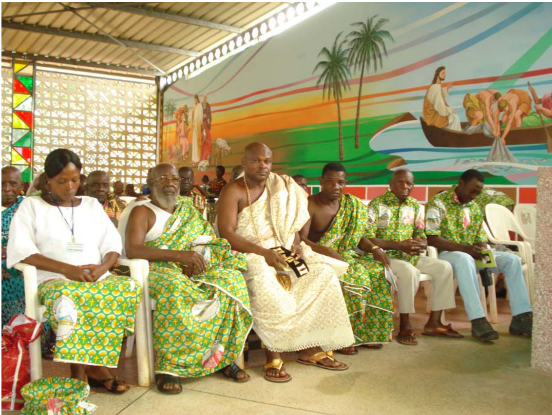
I notabili locali alla cerimonia