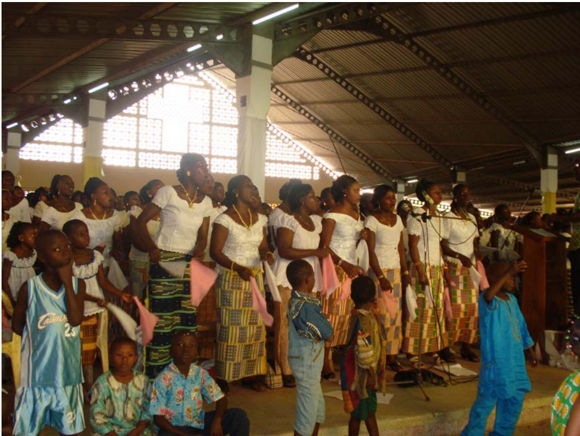
Le corali in azione durante la cerimonia di consecrazione