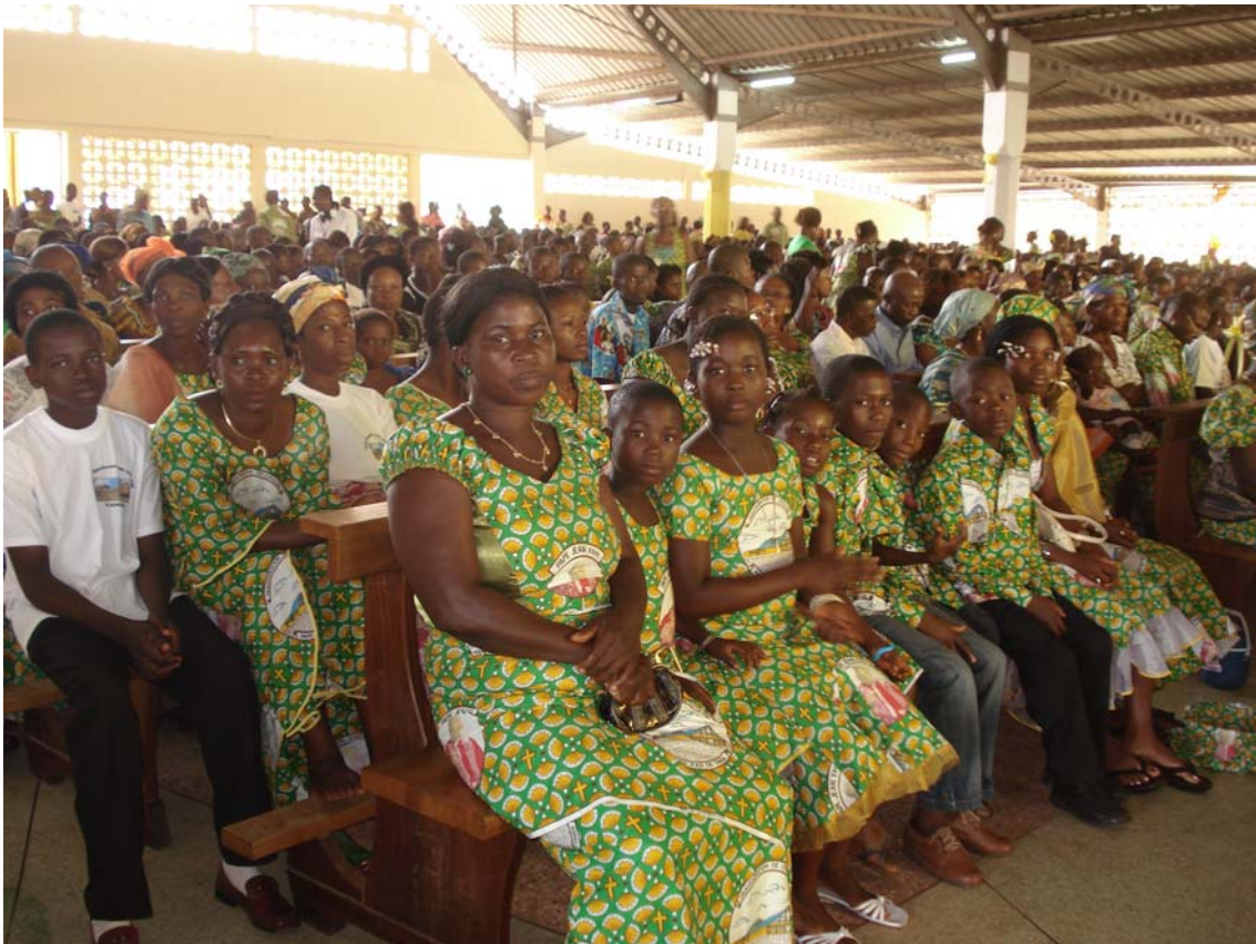
La variopinta comunita locale