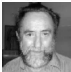
Rebussi p. Giuseppe Indonesia