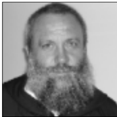
Marcassoli p. Gianluigi Costa d'Avorio