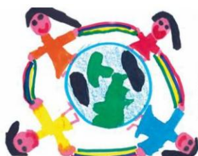
Esempi stampa retro bustina