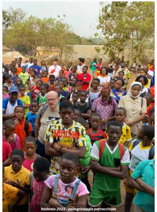
febbraio 2022 - pellegrinaggio parrocchiale