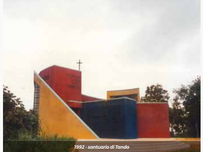
1992 - santuario di Tanda

di ogni tipo, acqua potabile con un rubinetto in casa.