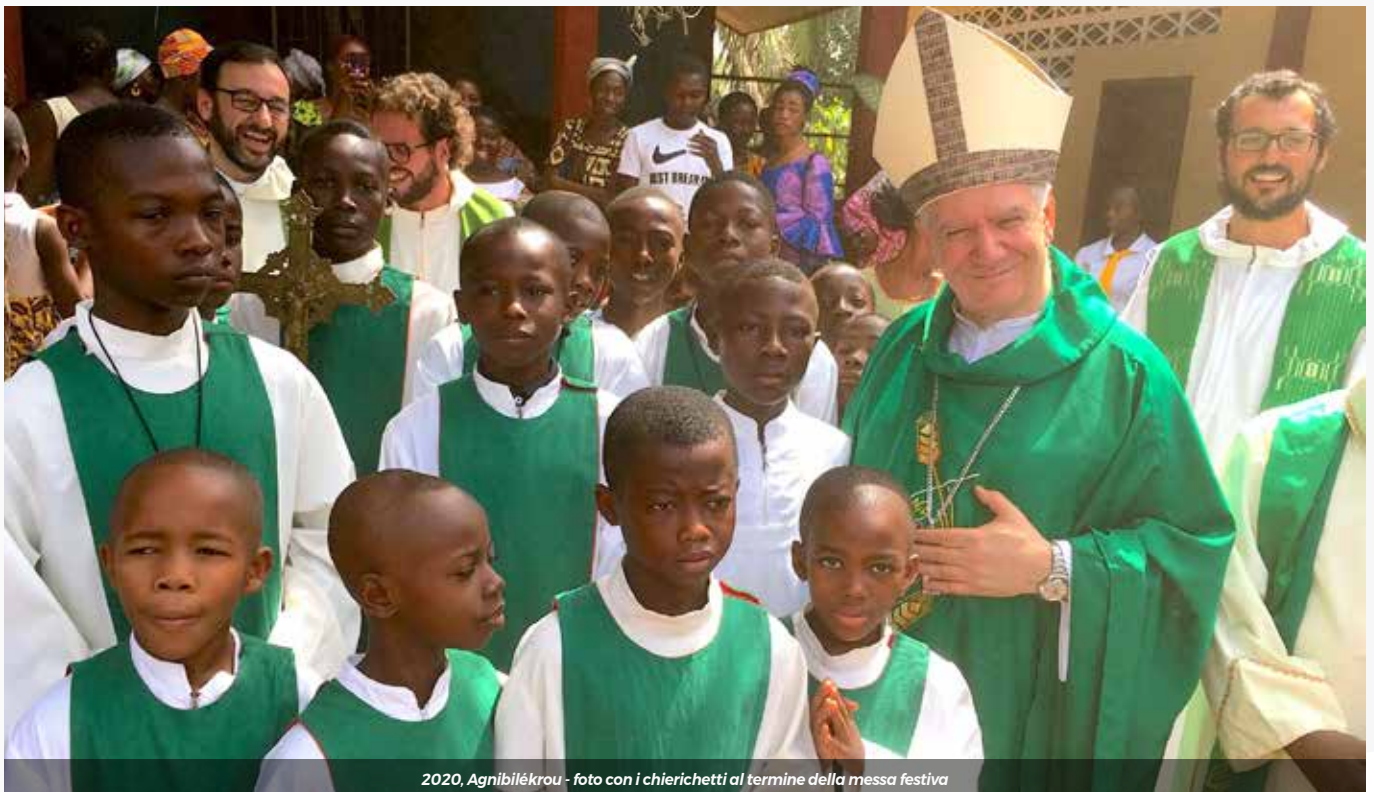
2020, Agnibélékrou - foto con i chierichetti al termine della messa festiva