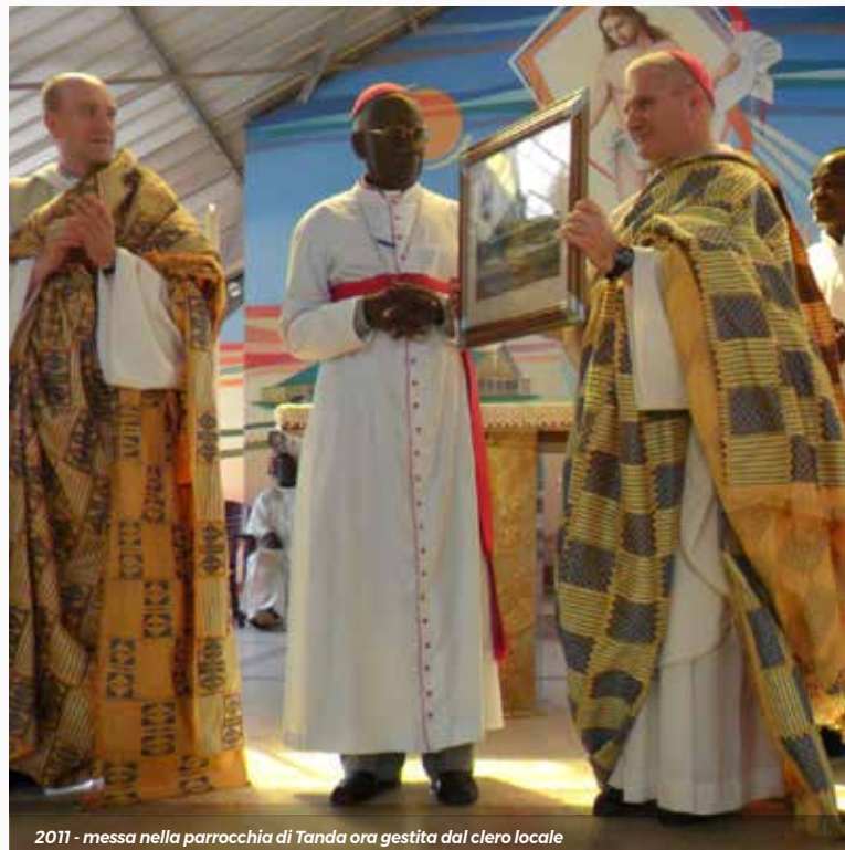
2011 - messa nella parrocchia di Tanda ora gestita dal clero locale