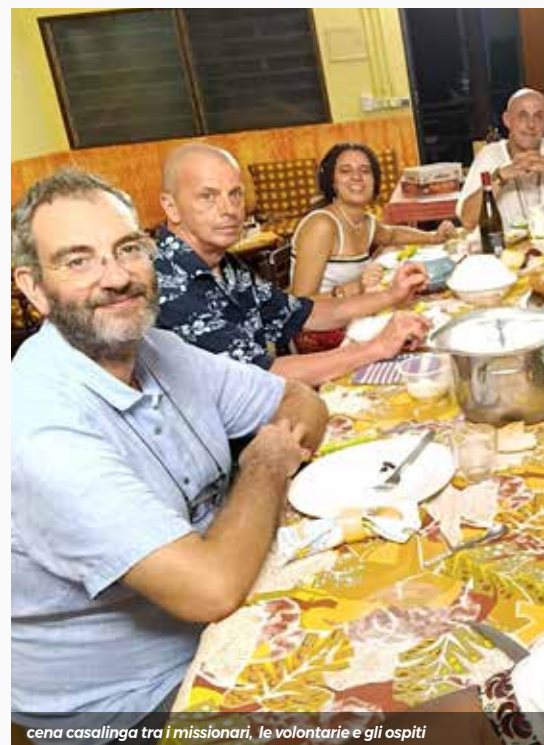
cena casalinga tra i missionari, le volontarie e gli ospiti