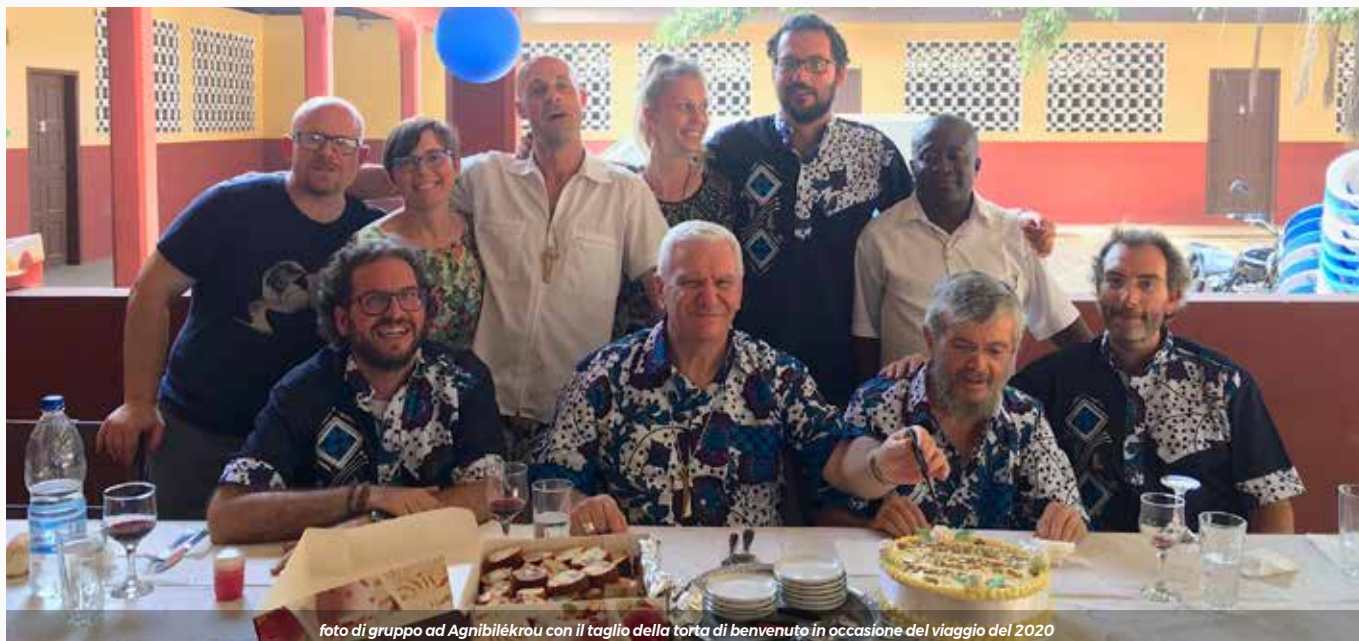
foto di gruppo ad Agnibilékrou con il taglio della torta di benvenuto in occasione del viaggio del 2020

attenzione, che richiede una particolare competenza e sforzo perché nella cultura di quel paese non è ancora così avvertita la consapevolezza della dignità e della ricchezza della vita delle persone con disabilità. Non solo devo ringraziare coloro che in questo momento stanno mettendo a punto una serie di progetti per il riscatto e la riabilitazione delle persone in queste condizioni, ma desidero che questo possa rappresentare un futuro della nostra missione in una terra ricca di sacerdoti, dove alcuni bisogni possono quindi essere meglio corrisposti localmente, mentre altri bisogni sono nuovi e richiedono quindi una risposta che noi - con rispetto e con la consapevolezza di accompagnarci a chi sta vivendo là - possiamo portare avanti. Certamente, l'attenzione alle persone con disabilità è uno di questi progetti.