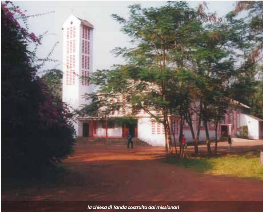
la chiesa di Tanda costruita dai missionari

incontrare le persone, insegnare il catechismo, ecc. Quello indiretto invece consisteva prendersi cura delle persone e dei loro bisogni, costruire progetti di utilità sociale, reperire le attrezzature utili alla comunità, aiutare le persone a prevenire e affrontare i problemi di salute, ecc. Tutto questo anche grazie ad alcune suore provenienti dall'Italia e da aiuti materiali. Dobbiamo anche ricordare che nel 1974 erano appena state create e integrate le prime scuole secondarie generali, pertanto in quegli anni c'era anche il bisogno di rinforzare l'alfabetizzazione: in uno scritto che mi è capitato di leggere don Francesco Orsini scriveva che la missione della parrocchia era opera dello Spirito Santo e che non potevamo più accontentarci di quello che facevamo prima, ma - con la presenza del collegio, con la presenza dei funzionari, con la presenza di questi giovani che volevano scoprire, capire quali progetti fare nella loro vita - bisognava cambiare metodo di lavoro. Inoltre, bisognava che i laici si assumessero le loro responsabilità e