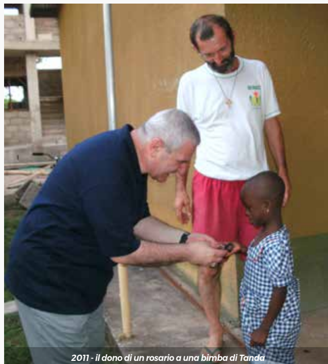
2011 - il dono di un rosario a una bimba di Tanga

Il terzo elemento è rappresentato dalle iniziative missionarie che per la prima volta avevo l'occasione di vedere con i miei occhi, come un ospedale, tutt'ora funzionante, segno della Diocesi di Brescia, allora impegnata in questo senso. E il lavoro: creare il lavoro, preparare le persone, dare loro delle competenze affinché potessero mantenere dignitosamente le loro famiglie.