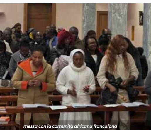
missa con la comunità africana francofona