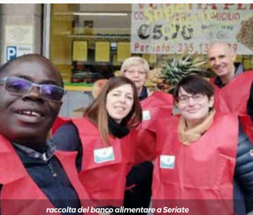
raccolta del banco alimentare a Seriate

È una grande gioia condividere la mia esperienza di missione a Bergamo. Il mio ruolo in questa diocesi è quello di essere cappellano della Comunità africana francofona che ha sede a Seriate, presso la casa delle suore della Sacra Famiglia di Comonte ed è uno spazio di incontro e di sostegno.