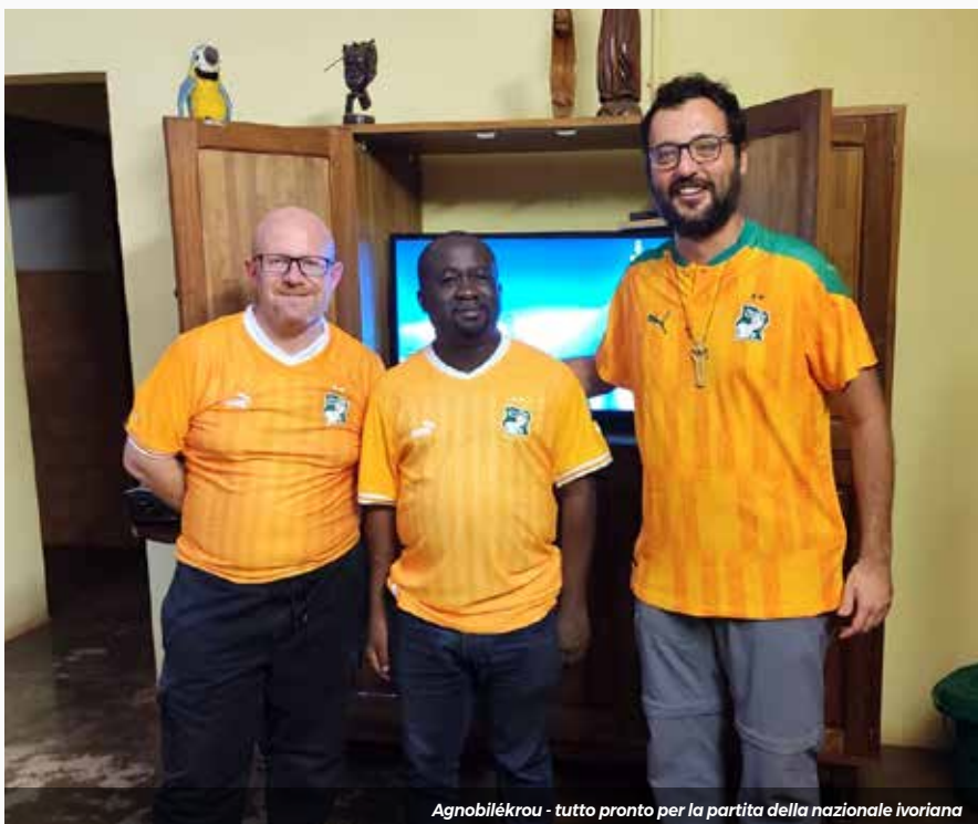
Agnobilékrou - tutto pronto per la partita della nazionale ivoriana

Rendo grazie a Dio per questa avventura umana e spirituale, che considero una grande ricchezza nel mio cammino sacerdotale. Auguro lunga vita e pieno successo alla collaborazione tra le diocesi di Bergamo e Abengourou.