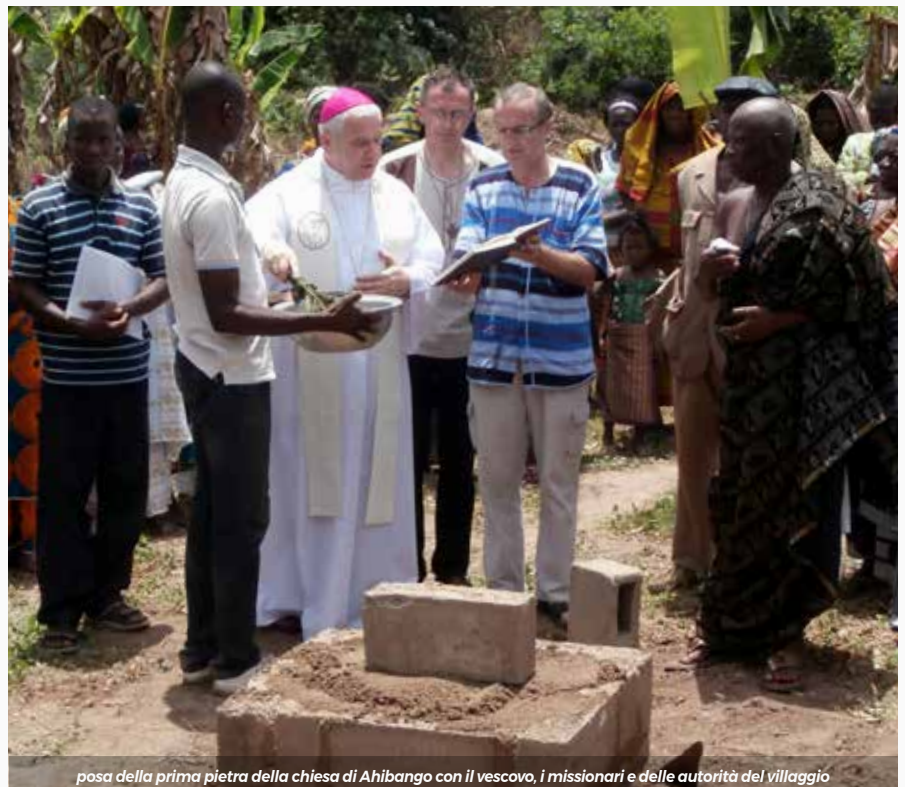
posa della prima pietra della chiesa di Ahibango con il vescovo, i missionari e delle autorità del villaggio

nano gli uomini tra di loro nei lunghi dialoghi, trattative, affetti, scambi commerciali e tanto ancora; le differenze avvicinano l'uomo a Dio con il canto, la danza, la preghiera il pianto e la malattia. La missione è diversità che diventa unità nella carità. Poi la carità ti riporta a casa, nella tua casa da dove tutto ha avuto origine. Un'altra differenza più marcata ti accoglie. Qui non c'è posto per l'improvvisazione, qui l'uomo non è il padrone del tempo, ma servo. La corsa contro il tempo ti soffoca, ti toglie il respiro. Tutto deve rientrare negli spazi del calendario dell'anno liturgico.