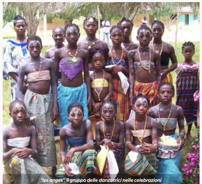
"les anges", il gruppo delle danzatrici nelle celebrazioni

Così ogni liturgia in Costa d'Avorio, è sottolineata da una forte spiritualità sempre animata da tamburi, altri strumenti musicali, danze e canti che sottolineano il progresso dell'animo ivoriano e aiutano e facilitano anche l'Evangelizzazione. È un modo di entrare in un rapporto sempre nuovo di affetto e di amicizia di questo popolo con la terra, con la cultura e soprattutto con Lui.