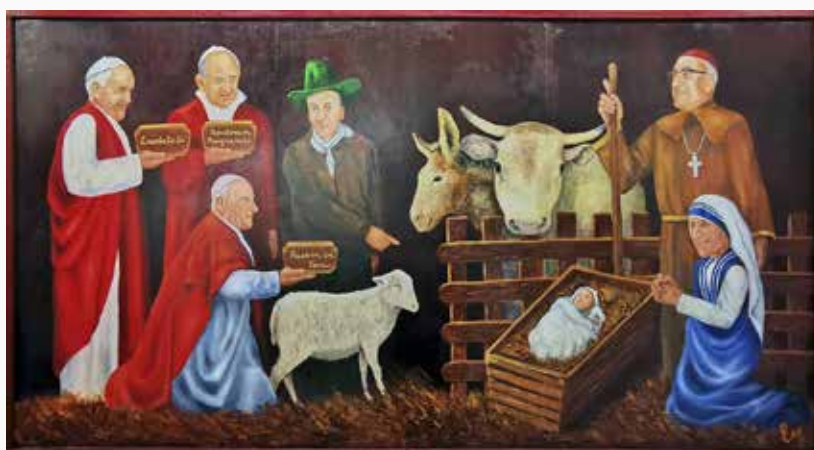
Natività contemporanea, Ennio Cobelli (2020) in presepi.basilicamariaausiliatrice.it . Per gentile concessione dei Salesiani di Don Bosco

Buon Natale, nell'attesa e nella scoperta, nella ricerca e nella gioia.